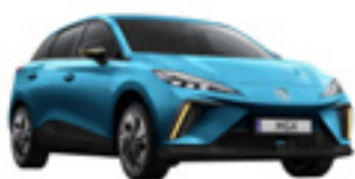
● Brighton Blue