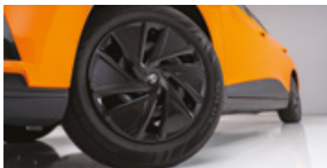
Jante din oțel de 16" cu capace negre - Explore