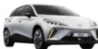
○ Dover White