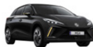
● Pebble Black