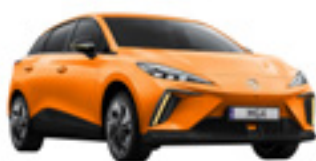
● Fizzy Orange