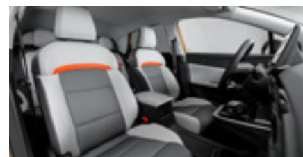
PU + Tapițerie din stofă în două culori gri/alb