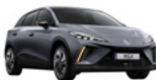
● Andes Grey