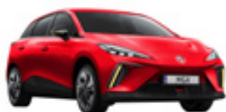
● Diamond Red