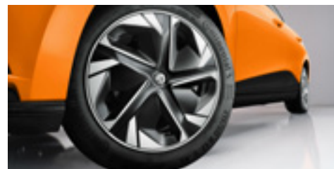
Jante din aliaj de 17" cu capace în două tonuri - Excite și Exclusive