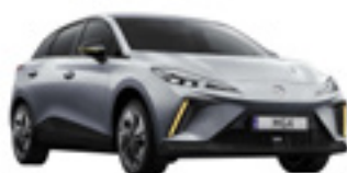
● Medal Silver