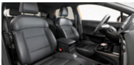
Tapițerie PU + stofă neagră